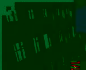
商贸管理类专业 综合训练场所